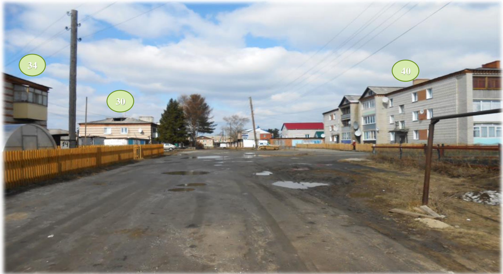
Рис.3. Дворовые территории МКД расположенных по адресу ул. Советская д.30, д.34, д.40