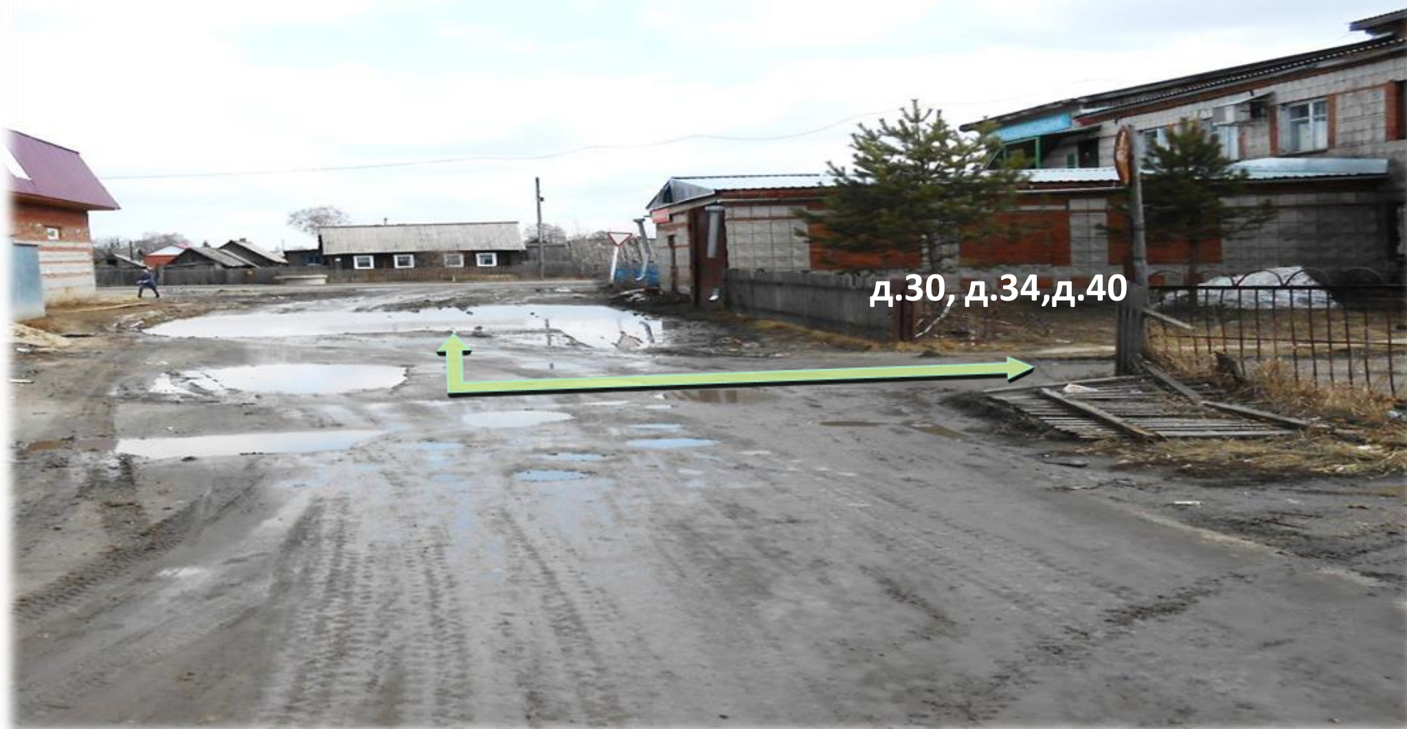
Рис.2. Въезд на дворовые территории МКД расположенных по адресу ул. Советская д.30, д.34 ( в том числе 26, 28, 30, 32, 36, 40)